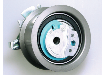
Şek. 1 Şimdiye kadar olan makara

Teslimat kapsamındaki V56340 gergi makarası, araç içinde kurulu olan makaradan görsel farklılık göstermekte ve doğru gerilmediği varsayılmaktadır.