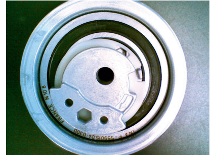
Şek. 2 ‘Yeni’ makara modeli

Fabrika çıkışlı olarak makara modeli Şek. 1’de olduğu gibi monte edilmiştir. Fakat yedek parça piyasasında hafif modifiye bir gergi makarası tedarik edilir; bkz. Şek. 2.